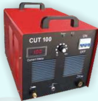
PRZECINARKA WF CUT 100 KOD: CUT100A141