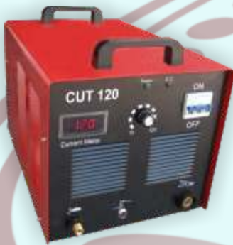
PRZECINARKA WF CUT 120 KOD: CUT120A141