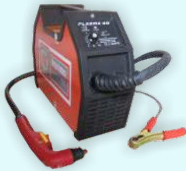
PRZECINARKA JLT PRO CUT 40 KOD: Y1362

Przecinarki plazmowe PLAZMA CUT przeznaczone są do cięcia elementów przewodzących prąd elektryczny, wykonanych ze stali węglowych i stopowych, aluminium i jego stopów, mosiądzu, miedzi, a także żeliwa. Wszystkie urządzenia z serii posiadają 60% sprawność cięcia. Główne zalety przecinarek to małe gabaryty oraz płynna regulacja prądu zapewniająca wysoką jakość cięcia materiału.