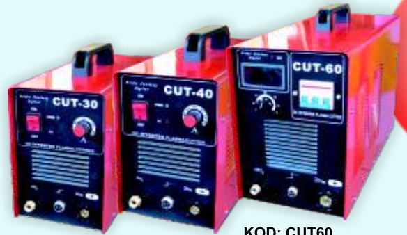
KOD: CUT30 KOD: CUT40 KOD: CUT60