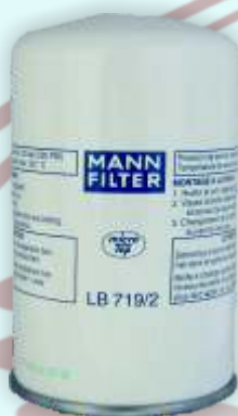
KOD: LB 719/2