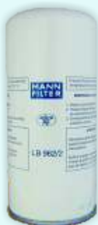
KOD: LB 962/2